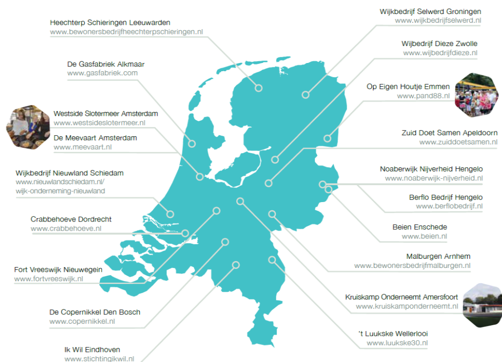
Figuur 2. Deelnemers onderzoek BewonersBedrijven (LSA Bewoners, 2019, p. 30)

In 2018 heeft het Landelijk Samenwerkingsverband Actieve Bewoners (LSA Bewoners) een onderzoek uitgevoerd naar wat men daar BewonersBedrijven noemt (LSA Bewoners, 2019). Aan dit onderzoek hebben negentien bewonersbedrijven meegewerkt; zie Figuur 2.